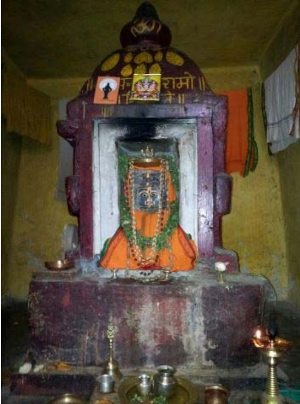
ಬದರಿಕಾಶ್ರಮದಲ್ಲಿರುವ ಶ್ರೀರಾಯರ ಚರವೃಂದಾವನ